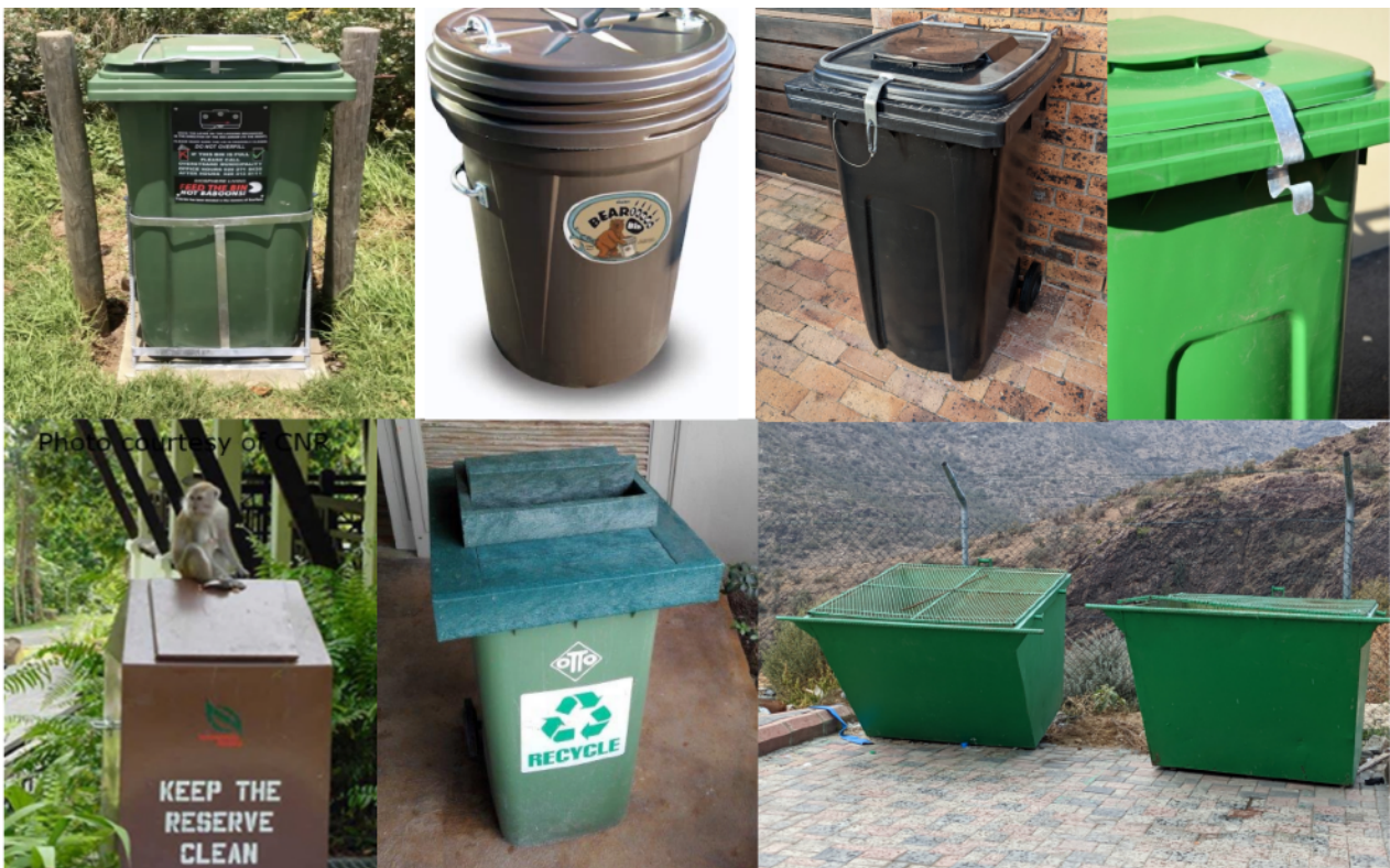
Figure 1. Exemples de conteneurs à déchets à l'épreuve des singes (Photo collage de Paula

Ici, nous nous concentrons sur l'approvisionnement non régulé des primates dans les zones urbaines et touristiques. Dans certains pays, des stratégies ont été mises en place pour limiter l'accès des primates aux déchets alimentaires humains dans les poubelles et autres grands conteneurs à déchets. Ces stratégies comprennent la séparation et le compostage des déchets organiques, ainsi que l'installation de conteneurs spécialement conçus pour être à l'épreuve des primates. Ceux-ci peuvent comporter des dispositifs tels que des loquets sécurisés, des couvercles à fermeture automatique ou à vis, et des conceptions empêchant le renversement des conteneurs (Figure1) (Effendy et al. 2024; Paramasivam 2024; Baker 2023). Dans les sites touristiques, les restaurants en plein air peuvent être recouverts de filets ou de cages en bois afin d'empêcher les primates d'entrer et de s'emparer de nourriture (Waters, Sengupta, Hansen et al. 2025; Cui et al. 2021). Toutes ces mesures présentent des niveaux d'efficacité variables. Par exemple, bien que les loquets de poubelles se soient révélés efficaces pour éliminer le pillage des déchets par les macaques à longue queue dans les zones urbaines de Malaisie, ils ne sont efficaces que si tous les foyers les utilisent (Paramasivam 2024); de plus, bien qu'ils soient disponibles dans le commerce, leur coût peut constituer un obstacle.